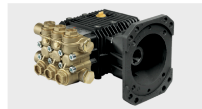
Zelfaanzuigende ZWD Comet pomp